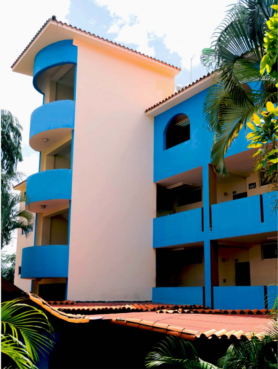
Facultad de Ciencias Económicas y Sociales | Edificio Azul

Formar profesionales en el campo de la contabilidad y finanzas con habilidades y conocimientos en áreas como la contabilidad, auditoría, fiscal, gestión financiera y la consultoría empresarial. Los contadores públicos son profesionales que se encargan de llevar registros financieros de una organización, realizar auditorías, presentar estados financieros con información confiable, preparar información fiscal para los organismos competentes y asesorar entidades públicas y privadas con la finalidad de que éstas alcancen sus objetivos y cumplan sus metas.