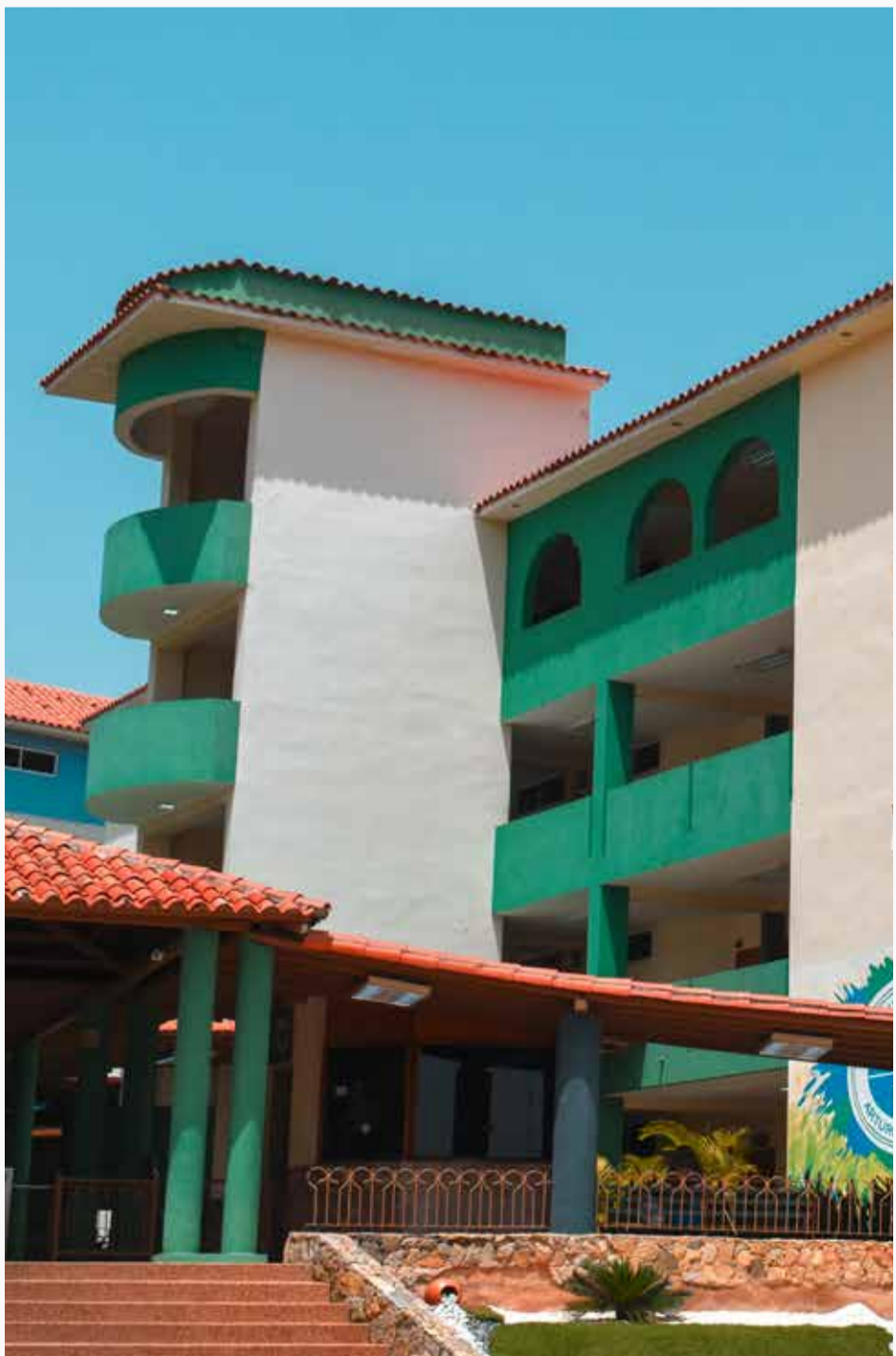
Facultad de Ciencias Jurídicas y Políticas | Edificio Verde