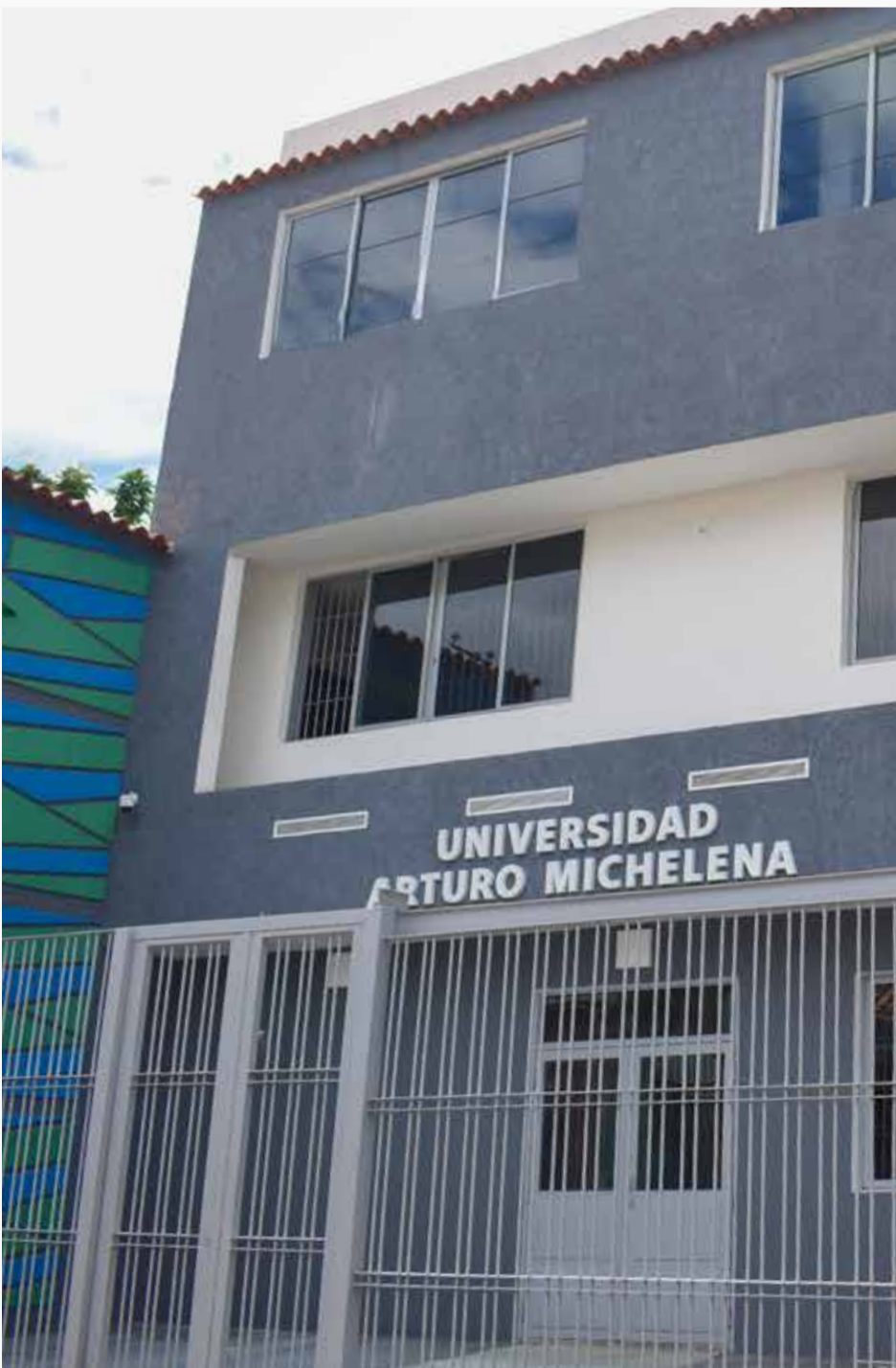
Sede Centro Histórico